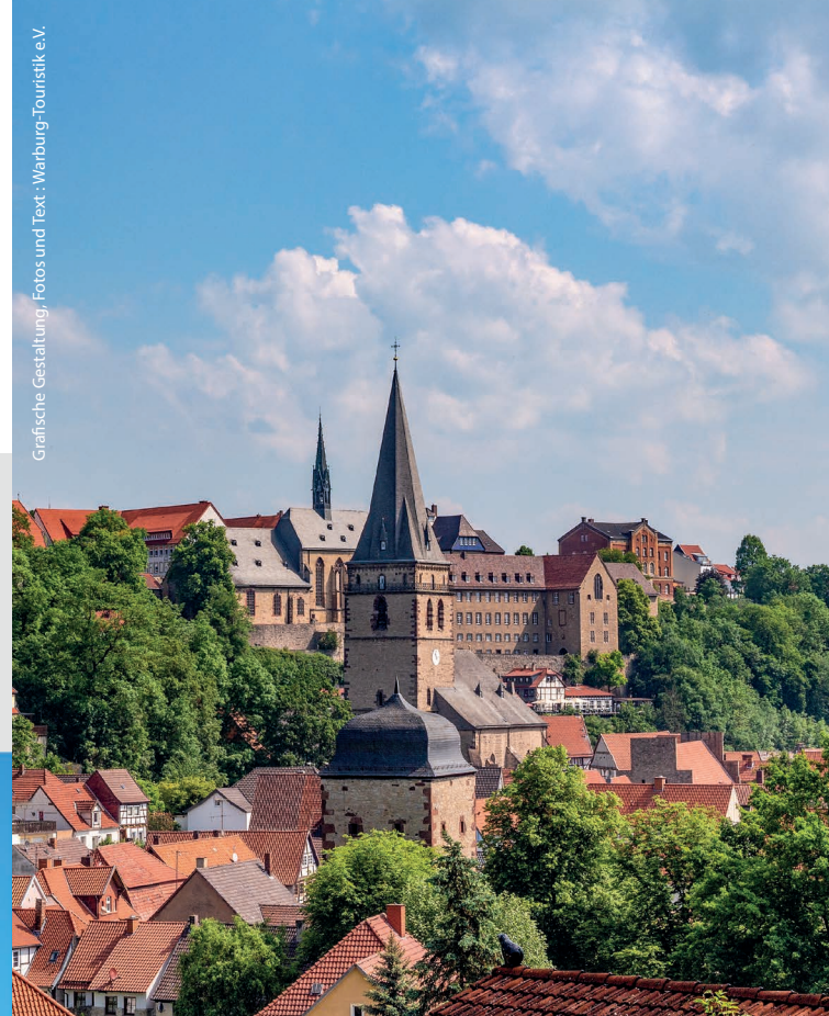
Grafische Gestaltung, Fotos und Text: Warburg-Touristik e.V.